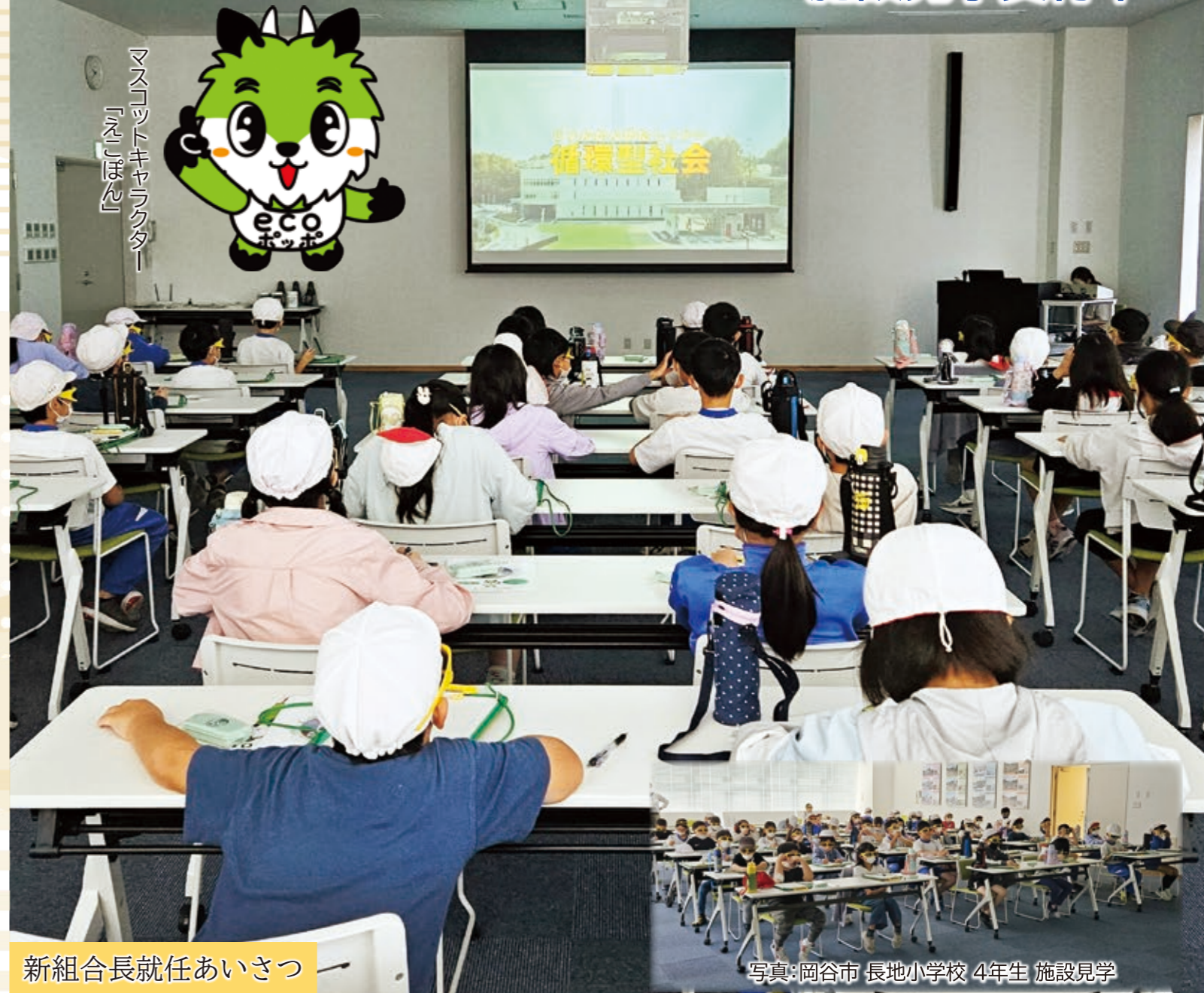
マスクottキャラクター「えこぼん」