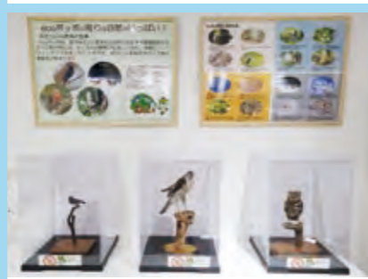
自然環境学習コーナー