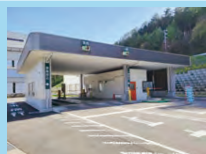
ごみの重さを計る計量棟