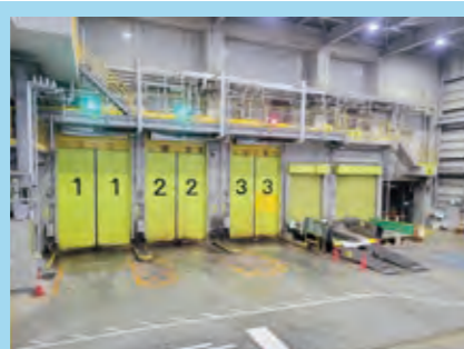
ごみを受け入れるプラットホーム