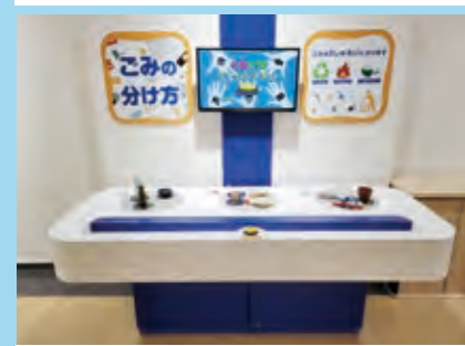
ごみの分別ゲーム