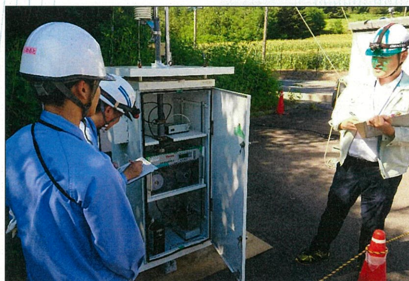
調査の様子 (H30.8.9 樋沢地区調査地点)

H29調査結果はいずれの項目においても環境基準等の数値を下回る高い安全性を確認できました！